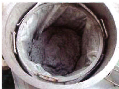
研磨氧化鋁脫水後污泥