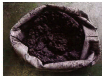
研磨軸承鋼脫水後污泥